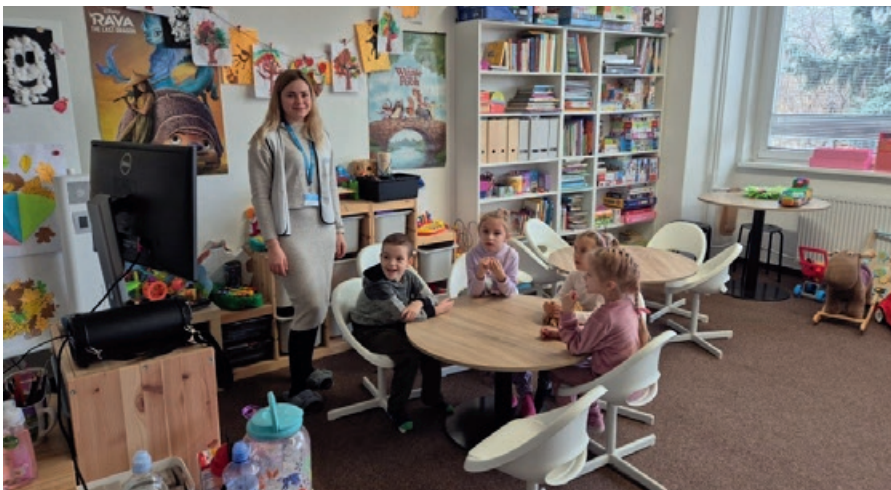
Obrázok č. 4: Miestnosť s detským kútikom a škôlkou