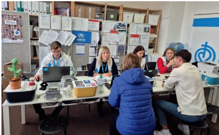
Obrázok č. 1 a 2: Pracovníci COMIN počas poskytovania individuálneho poradenstva